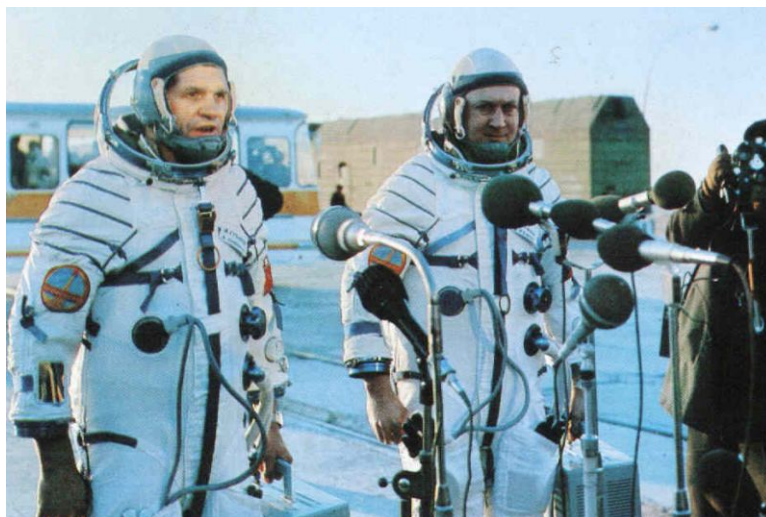
Hlášení posádky o připravenosti ke startu.