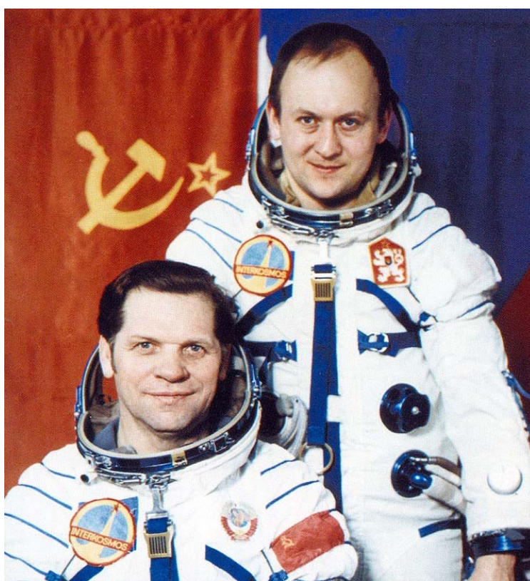
Oficiální portrét posádky Sojuz 28 - vlevo Alexej Gubarev (velitel), vpravo Vladimír Remek (kosmonaut-výzkumník).