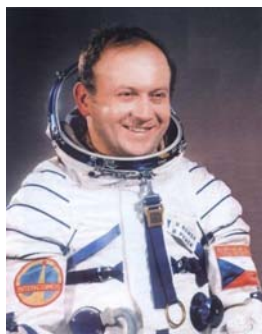
Československý kosmonaut Vladimír Remek.