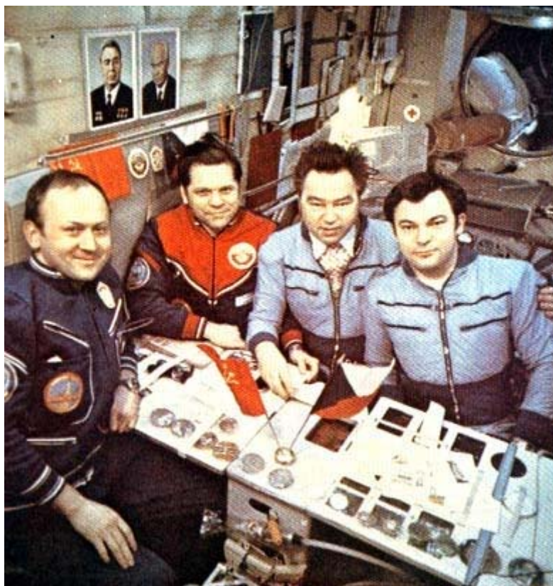
Posádky Saljutu 6 a Sojuzu 28 - zleva: Vladimír Remek, Alexej Gubarev, Georgij Grečko a Jurij Romaněnko.