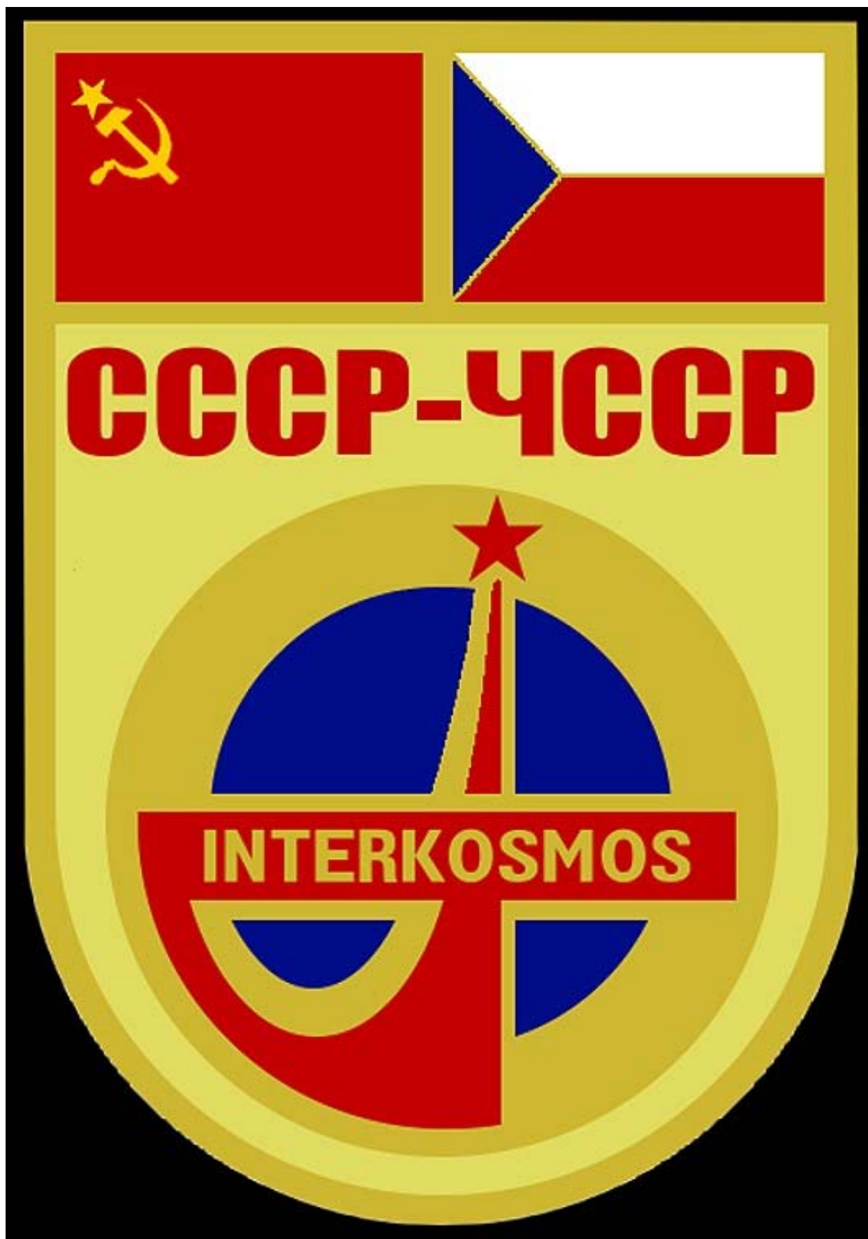
Logo mezinárodního kosmického letu ČSSR-SSSR v programu Interkosmos.