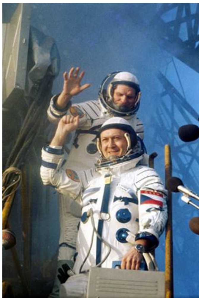
Poslední pozdrav před startem.